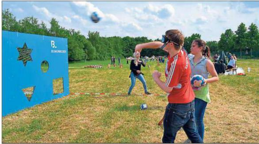
Löcher treffen mit Rauschbrille: Das Torwandschießen der Blumenbecker-Gruppe hatte es in sich. Die Auszubildenden von zehn Beckumer Firmen hatten die Spiele im Vorfeld entwickelt.