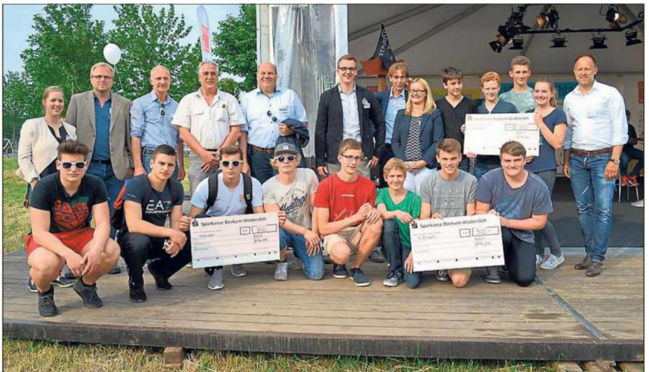
Die drei Siegerteams stellten sich mit den Ausbildern und Vertretern des Industrievereins zum Erinnerungsfoto auf. Das Team „Knödelmänner“ des AMG (unten rechts) machte das Rennen.

Für die ersten drei Gewinner-teams gab es als Preis 500, 300 oder 200 Euro für die Klassenkasse. Auf dem dritten Platz landete das „A-Team“ (Kopernikus-Gymnasium). Den zweiten Rang sicherten sich „Die Realen“ (Realschule) und den Sieg erspielten sich die „Knödelmänner“ des AMG.