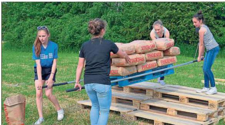
Muskelkraft und Geschick waren beim Zementsackrennen der Phoenix Zementwerke gefragt. Die Teams gaben alles und bewiesen Durchhaltevermögen.