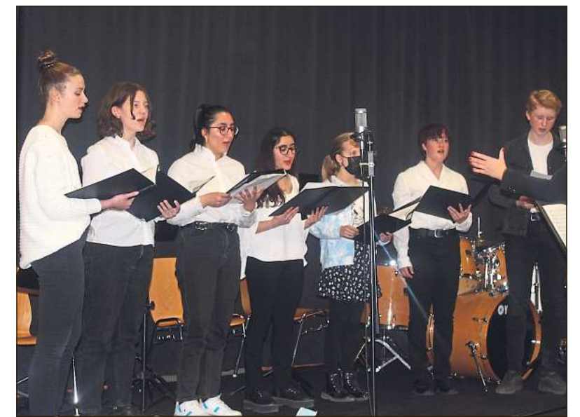
Zahlreiche Beiträge begeisterten beim Frühlingskonzert des Albertus-Magnus-Gymnasiums die Zuhörer.

Im Anschluss informierte sich der Minister bei der Ferber-Software GmbH zum Thema Nachhaltigkeit.